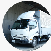
運搬も請け負っています