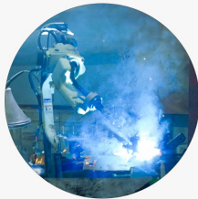
半自動溶接・自動ロボット溶接・ スポット溶接に対応