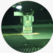
折曲加工機や最新設備のレーザー加工機を導入

弊社では、小さなモノから大きなモノまでお客様のニーズに合わせて様々な加工をいたします。